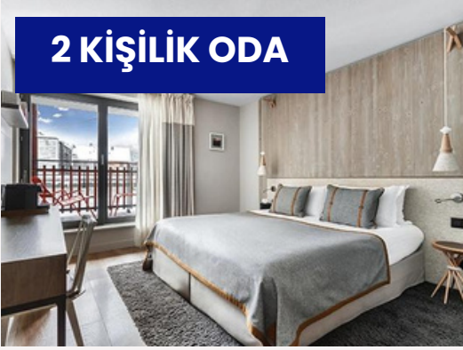
2 KİŞİLİK ODA