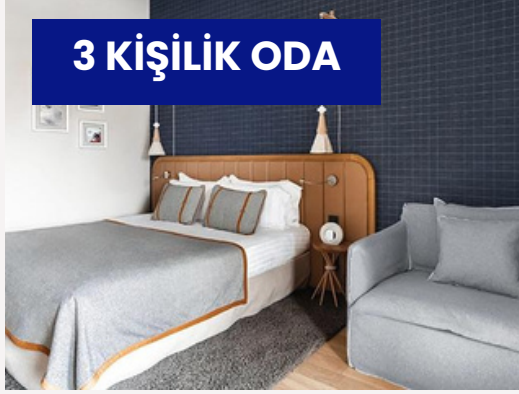
3 KİŞİLİK ODA